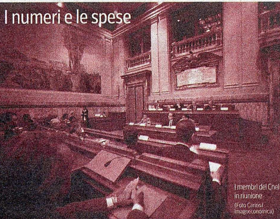
I numeri e le spese

Fanno fare un salto sulla sedia, certe voci che si trovano nel bilancio del Cnel. Come gli 8 milioni 543 mila euro di non meglio precisate «spese per l'espletamento delle funzioni istituzionali», quattro milioni più del 2012: il bello è che diventeranno addirittura 15 nel 2014. Oppure il milione e mezzo di spese per «pubblicità, comunicazione e relazioni istituziona-